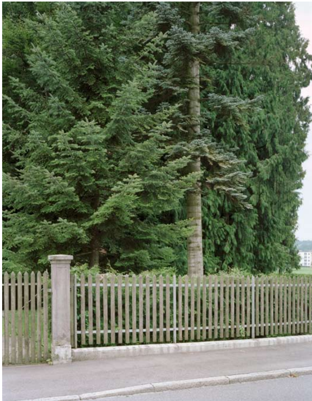
HALDENSTRASSE, BAAR 2008 c-print 73 x 92 cm