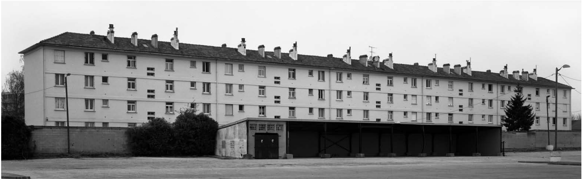
RUE DU PETIT PRINCE, THIAIS 2007 gelatin silver print 113 x 34 cm