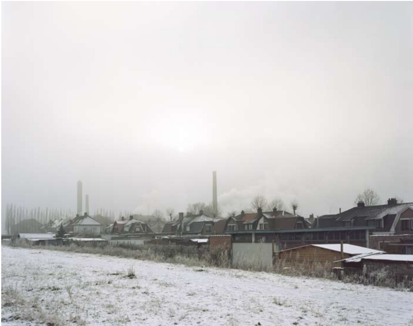
HEILIGE PUTSTRAAT, ANTWERPEN 2008 c-print 27 x 21,5 cm