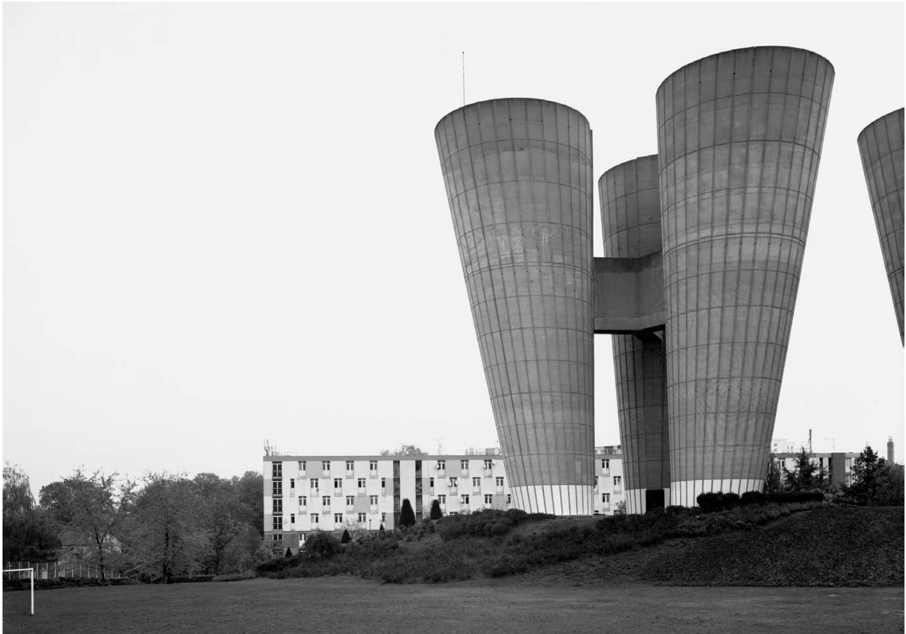
AVENUE DU PRÉSIDENT ALLENDE, VILLEJUIF 2007 gelatin silver print 100 x 61 cm