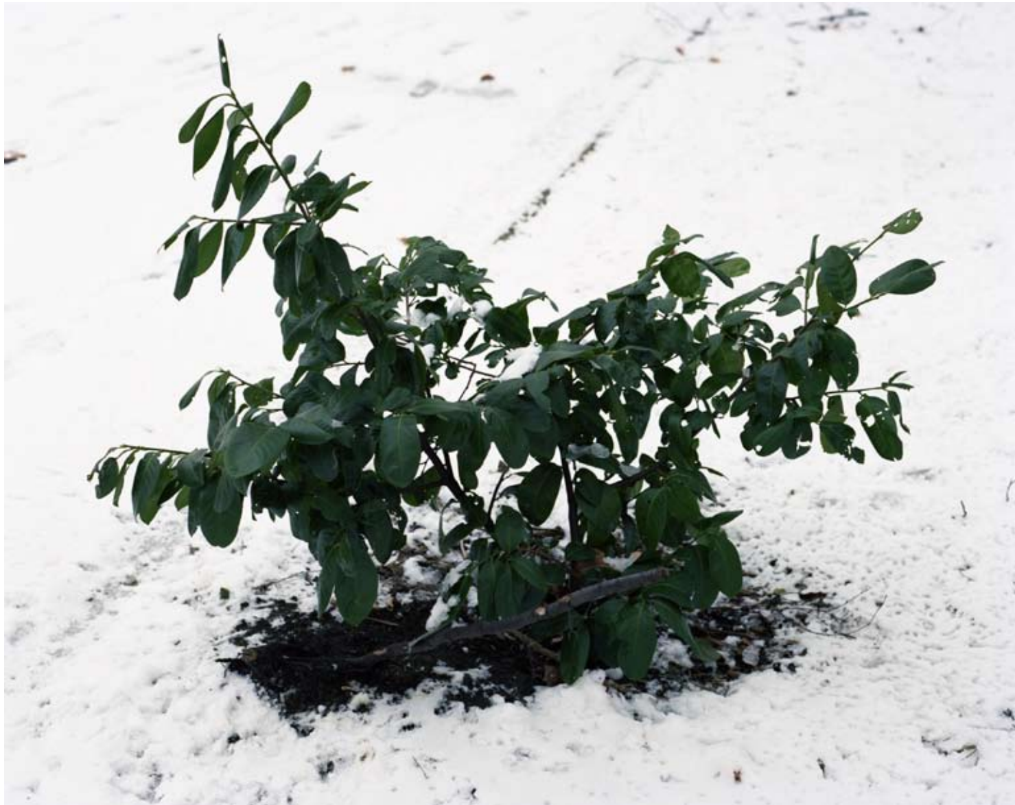
THONETLAAN, ANTWERPEN 2009 c-print 54 x 44 cm