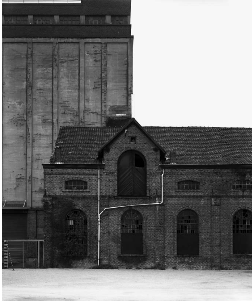
TRAPSTRAAT, ANTWERPEN 2009 gelatin silver print 27 x 22,5 cm