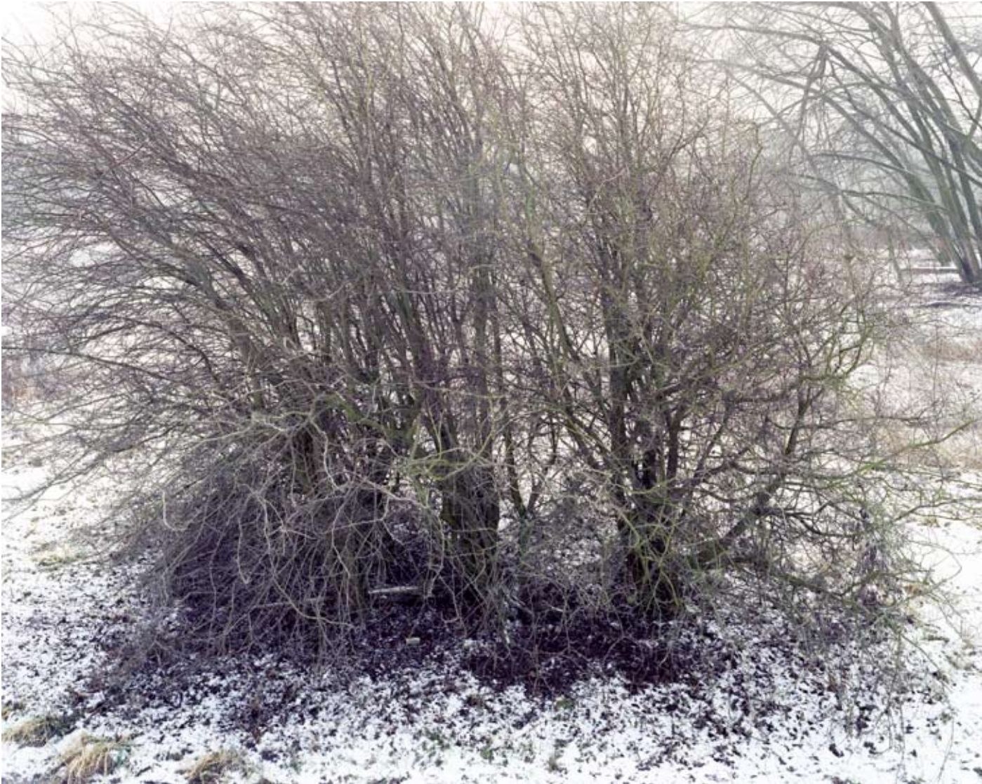
PETROLEUMKAAI, ANTWERPEN 2009 c-print 65 x 50 cm