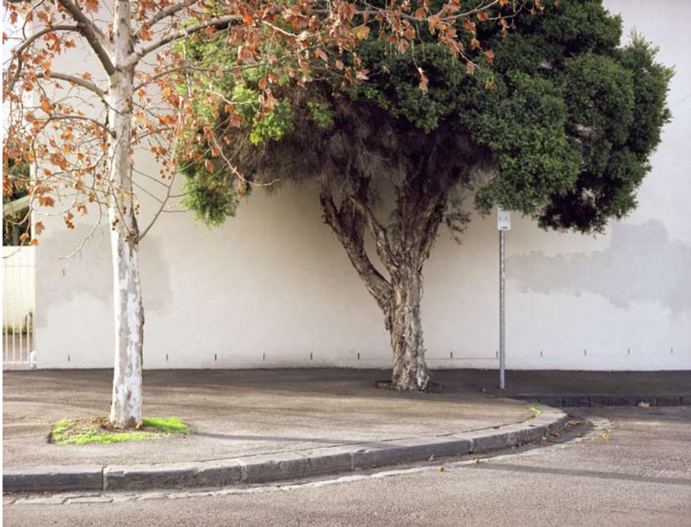
MELBOURNE 2006 c-print 64,5 x 49 cm