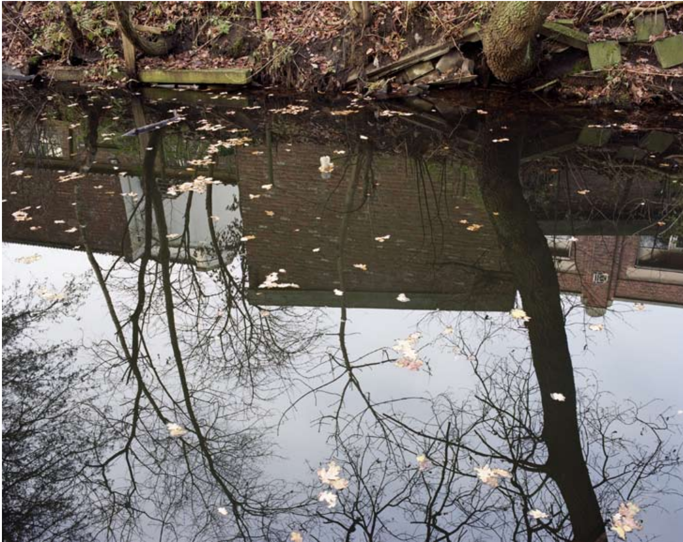
DONK, EDEGEM 2008 c-print 70 x 56 cm