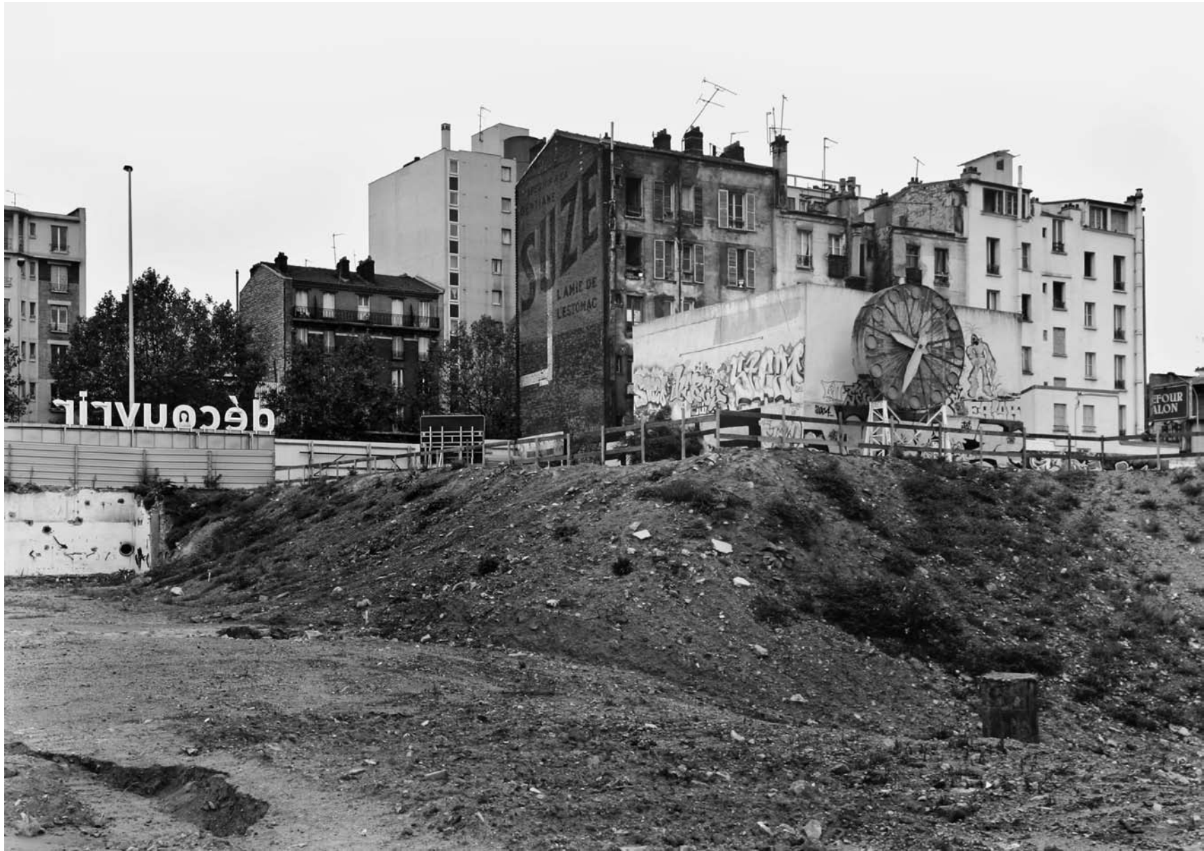
AVENUE DE FONTAINEBLEAU, LE KREMLIN BICÊTRE 2007 gelatin silver print 78,5 x 56 cm