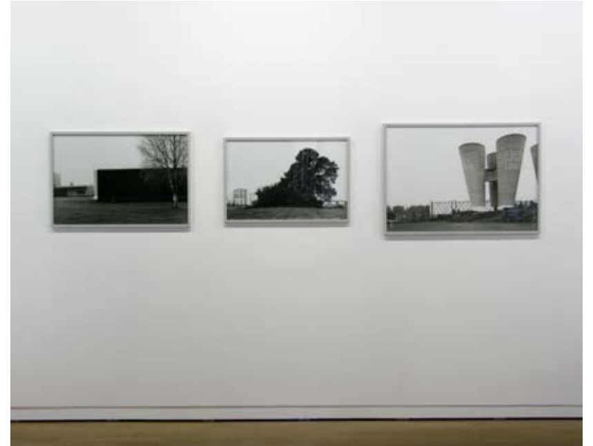
Dix-7 en Zéro-7 , Fondation d'Entreprise Ricard, Paris 2008