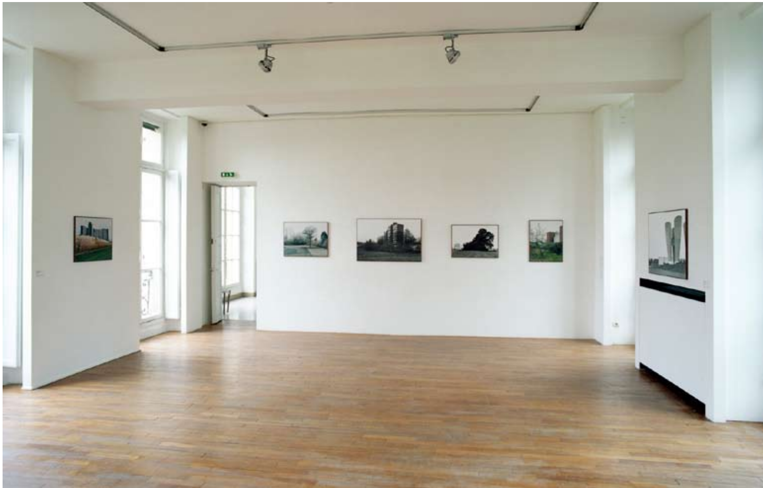
Terra Nullius (Jeu de Paume hors les murs), Maison d'Art Bernard Anthonioz, Nogent sur Marne 2008