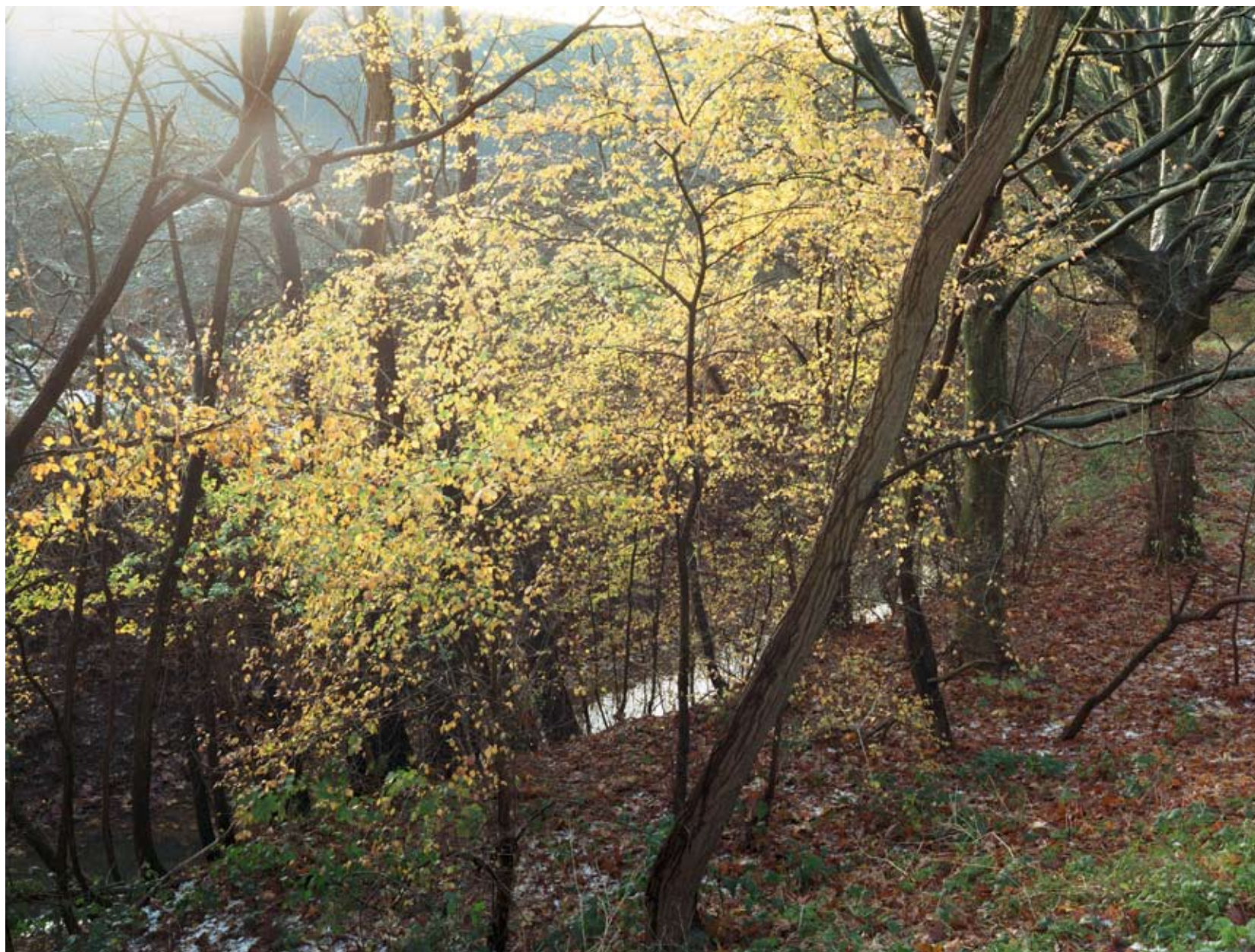
POLDERBOS , HOBOKEN-POLDERSTAD 2008 c-print 100 x 130 cm