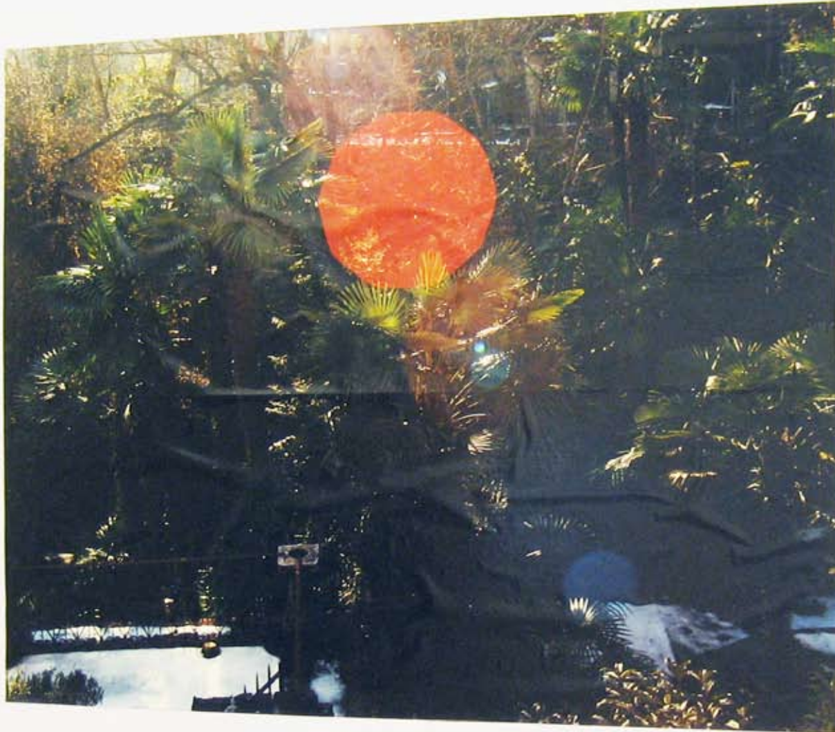
VIA GIUSEPPE ZOTTI, LUGANO 2010 C-print, maroufflé 260 x 210 cm