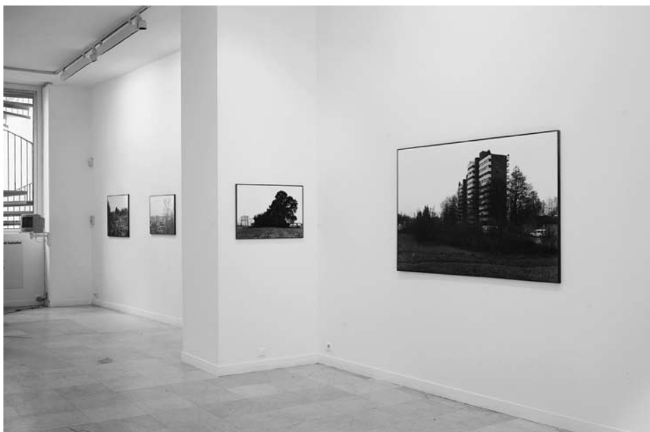
Printemps de Septembre à Toulouse 2007, Espace Croix-Baragnon