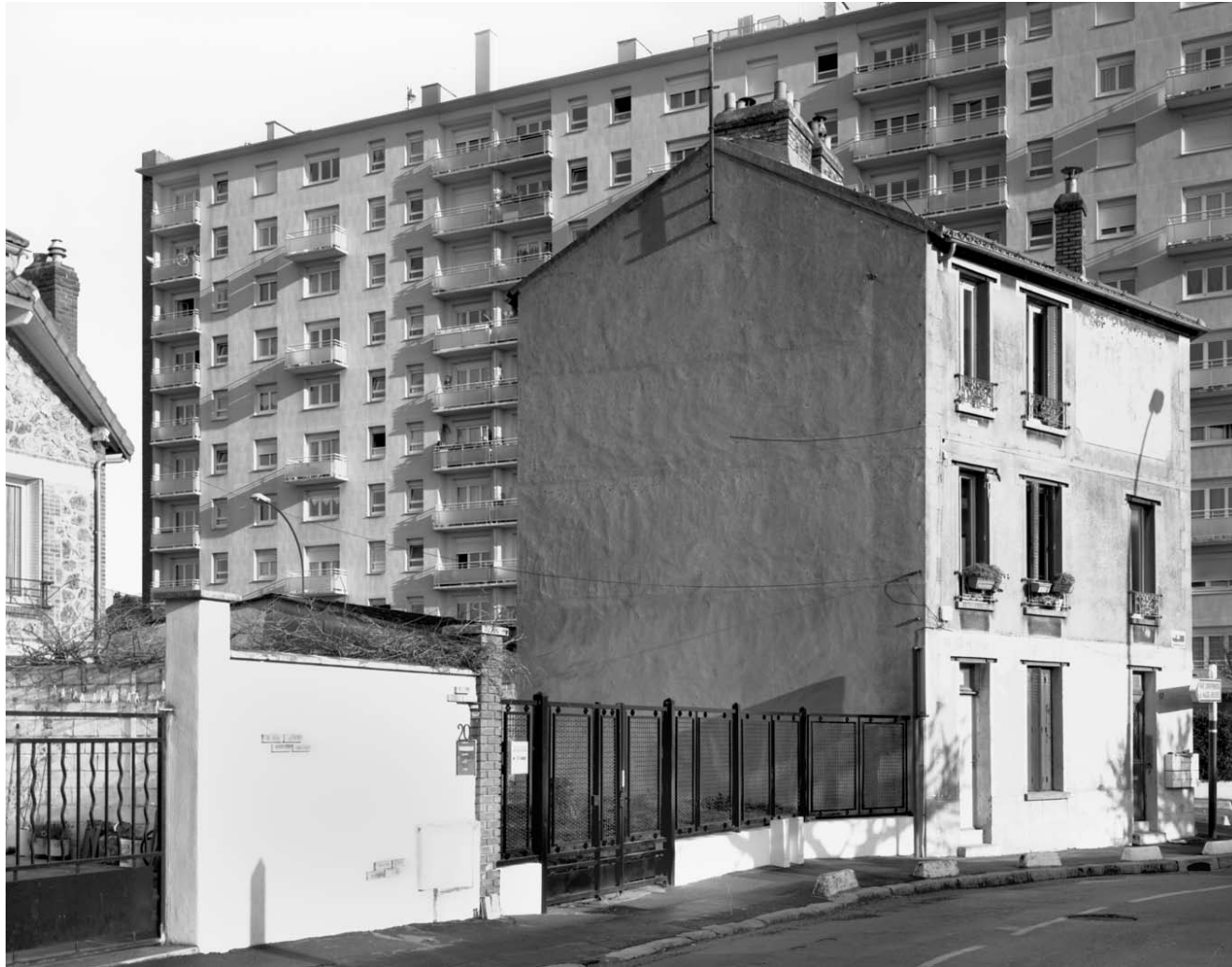
AVENUE DE LA RÉPUBLIQUE, VILLEJUIF 2008 gelatin silver print 76 x 54 cm