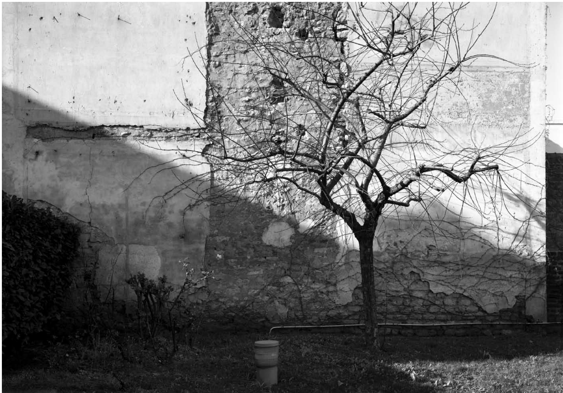
RUE PIERRE ET MARIE CURIE, IVRY-SUR-SEINE 2007 gelatin silver print 83 x 59 cm