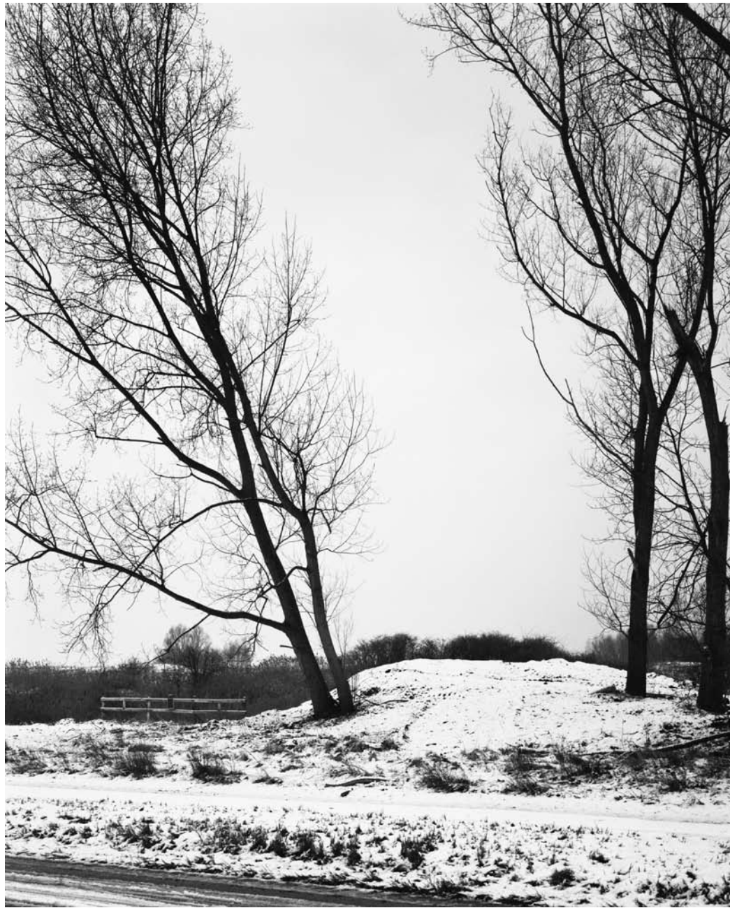
CHARLES DE COSTERLAAN, ANTWERPEN 2009 gelatin silver print 26,5 x 33 cm