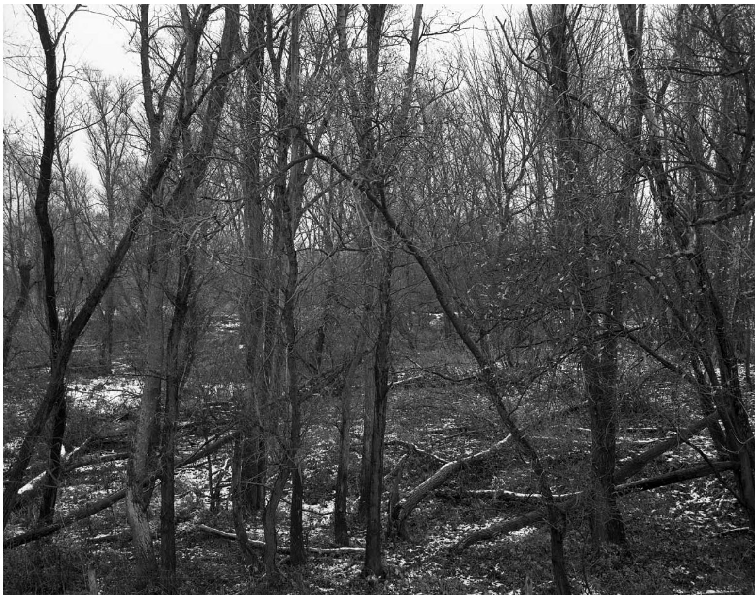
POLDERBOS II, HOBOKEN-POLDERSTAD 2008 gelatin silver print 37 x 29 cm