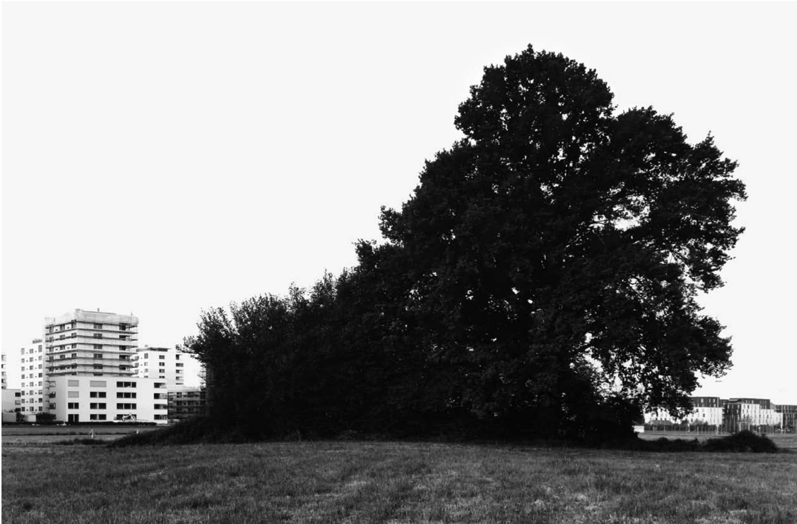
SCHLEIFE, ZUG 2007 gelatin silver print 73 x 51 cm