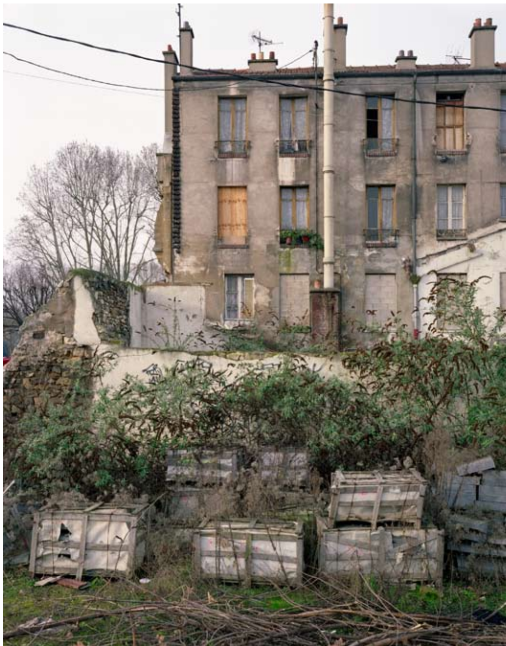
AVENUE DE VERDUN, IVRY-SUR-SEINE 2008 c-print 54,5 x 68 cm