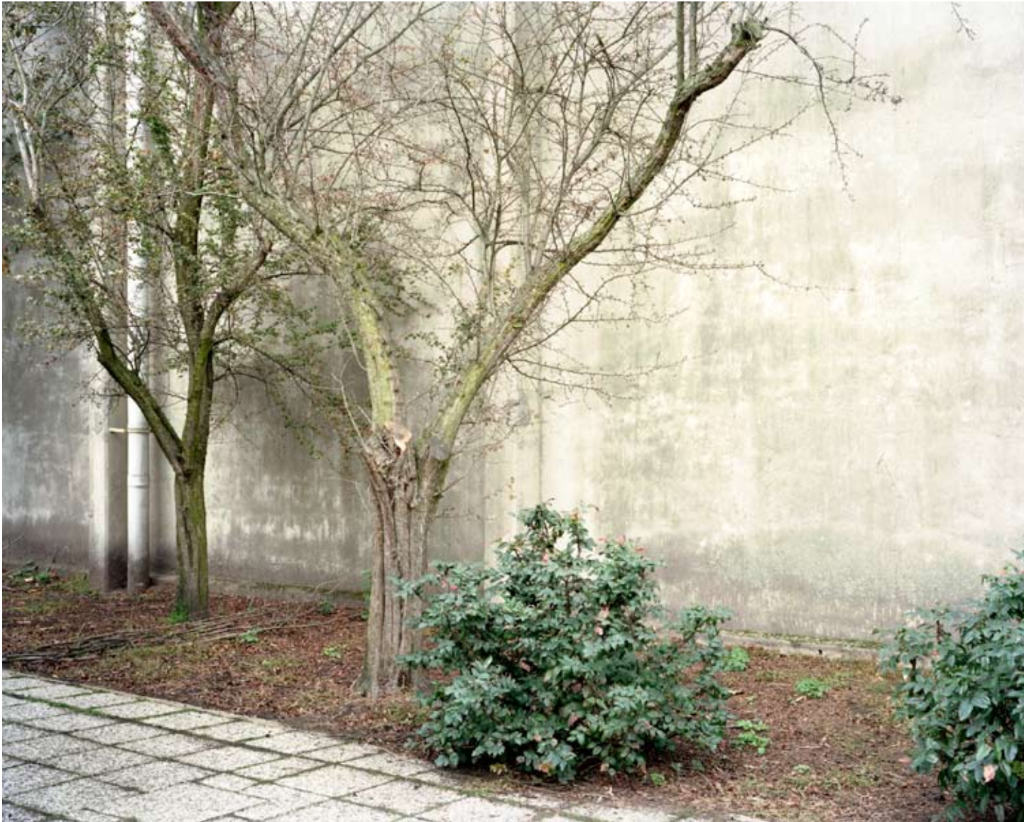
HAVEN 50, ANTWERPEN 2008 c-print 97 x 75 cm