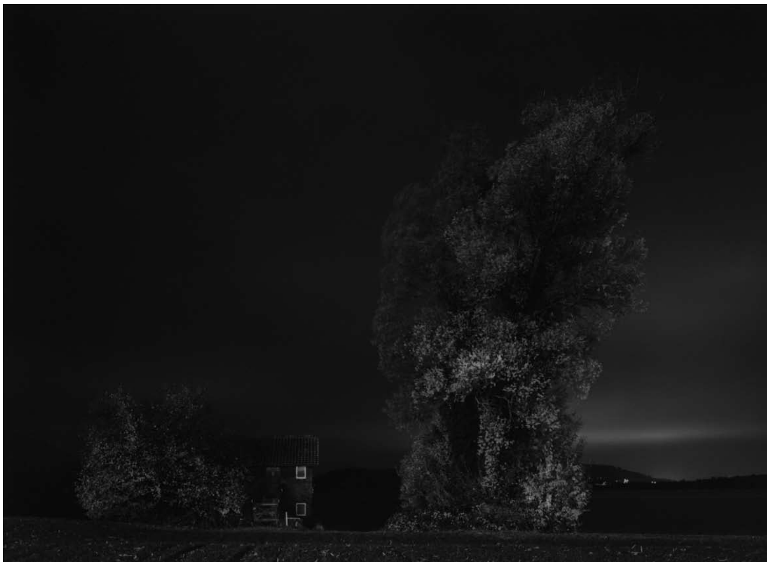
CHAMERSTRASSE, ZUG 2008 gelatin silver print format non défini