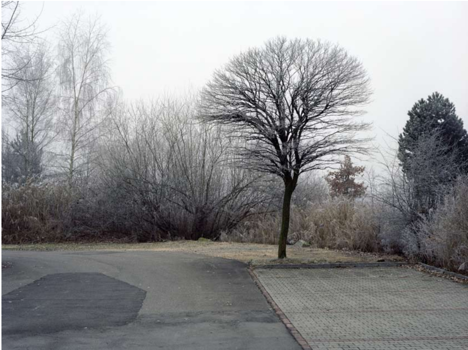
SENNWEID I, STEINHAUSEN 2008 c-print 74 x 54 cm