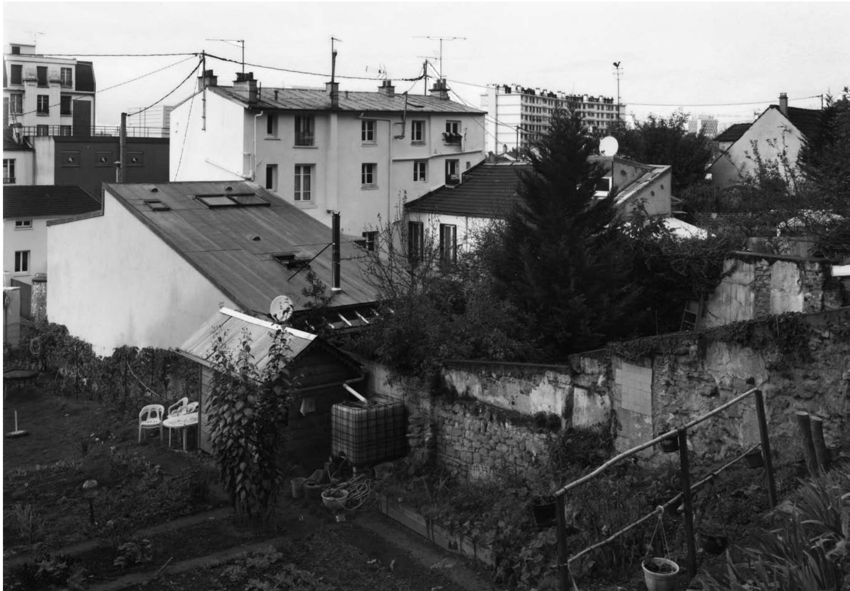
RUE ANTOINE THOMAS III, IVRY-SUR-SEINE 2007 gelatin silver print 76 x 54 cm