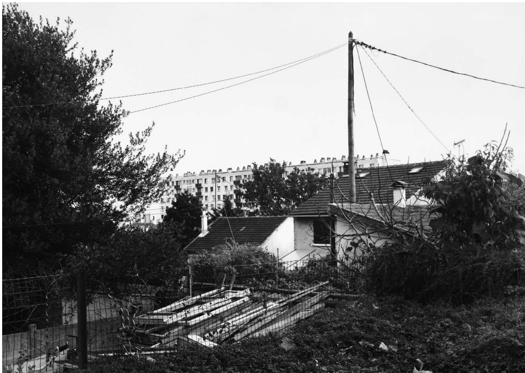
AVENUE DE PARIS, VILLEJUIF 2007 gelatin silver print 78 x 55,5 cm