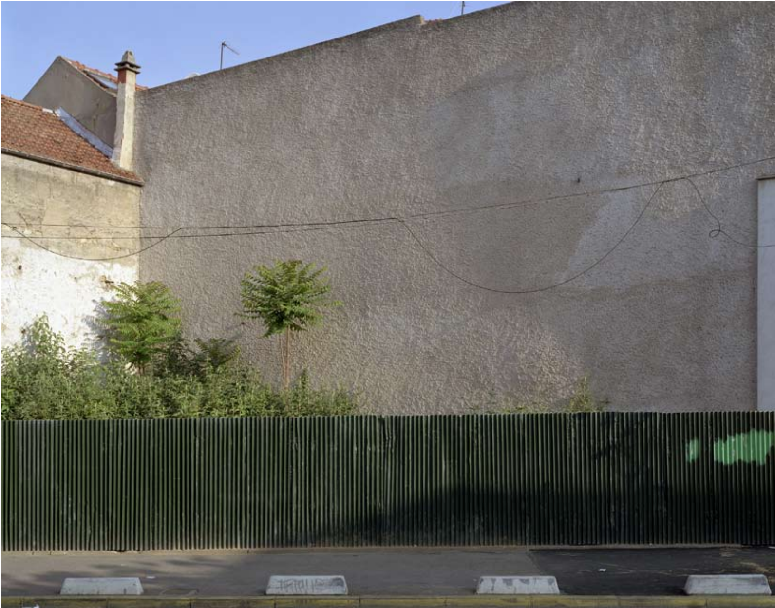
AVENUE PAUL VAILLANT COUTURIER, VILLEJUIF 2008 c-print 79 x 63 cm