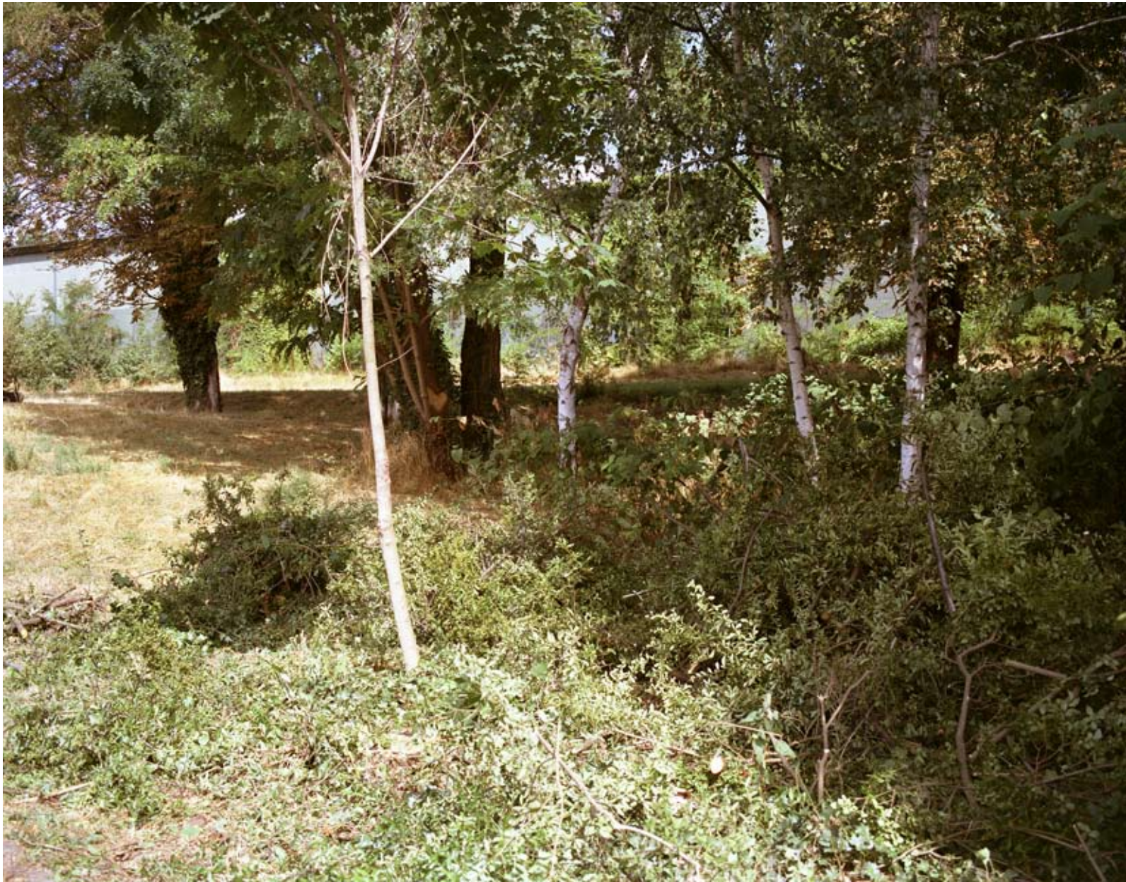
CHEMIN DE HALAGE, ST. MAURICE 2008 c-print 44 x 35 cm